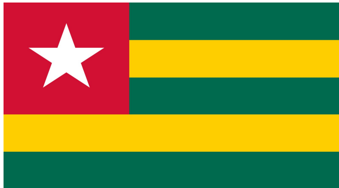
Le Drapeau togolais