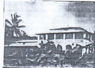
L'école officielle de Lomé (1904).