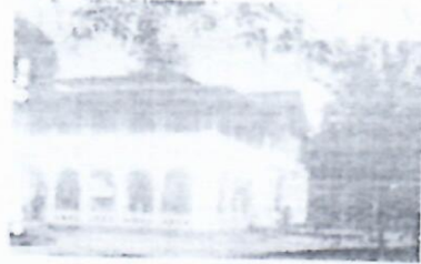
L'hôpital Nachtigal d'Aného