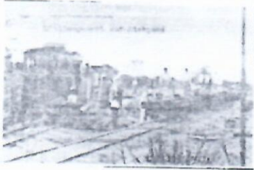
Rails d'Agbonou vers Atakpamé

« Les Allemands ont réalisé des actions positives sur les plans économique et social au Togo. Ils ont accompli des œuvres qui continuent par nous servir jusqu'à ce jour », disait votre professeur d'histoire-géographie lors d'une séance de cours. Après le cours, il vous revient de faire ressortir les œuvres allemandes sur le plan économique (transports et commerce) et leurs actions sur le plan social. En t'appuyant sur les documents ci-dessous et sur les cours reçus en classe, expose ton travail.