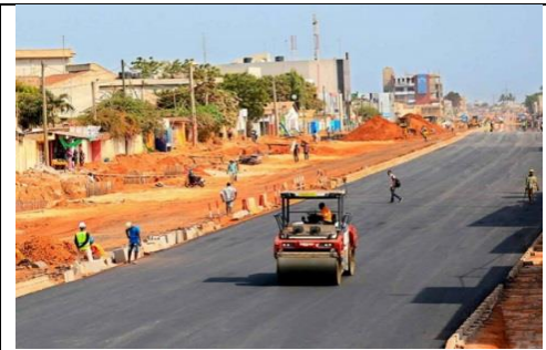
Document 1 : Aménagement de la voie de contournement de Sokodé

Consigne 2 : Montre-lui que le commerce togolais rencontre effectivement des difficultés.