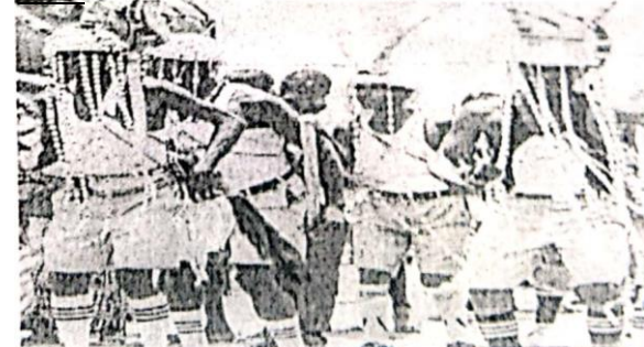
Doc4 danseurs et rites initiatiques