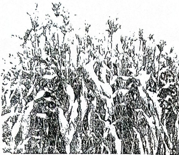
Document 1 : Culture du sorgho