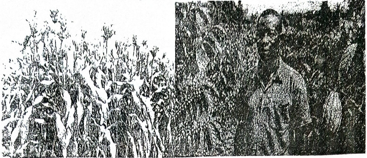
Document 2 : Cultures du café et du cacao