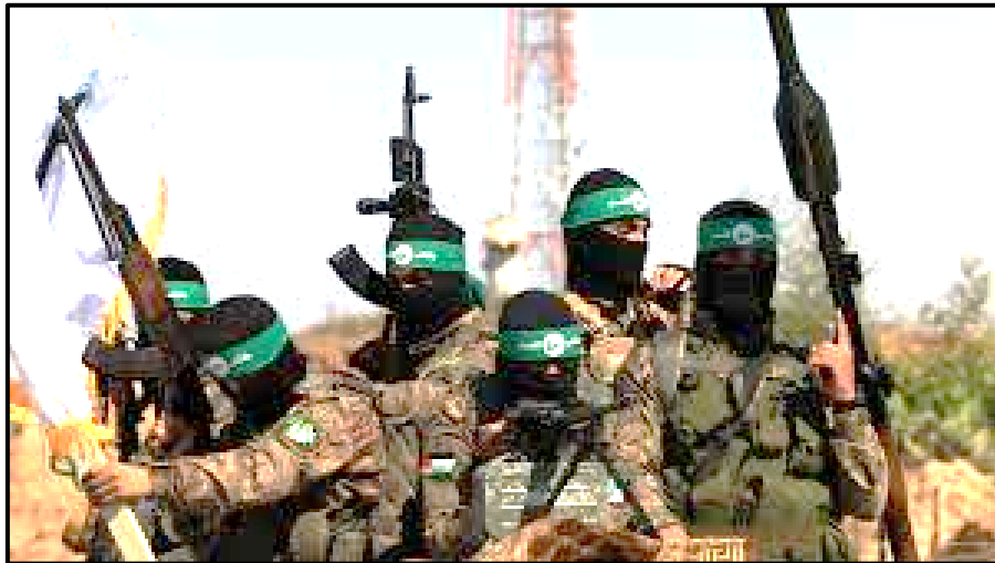
Photo 4 : Des combattants du Hamas, le 19 juillet 2023, à Gaza

Au début du cours sur l'extrémisme violent, votre professeur d'ECM affiche l'image suivante :