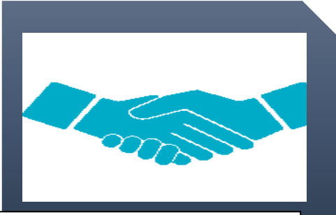
Photo 21 : Google le 15/12/2023

Face à la « menace terroriste » et aux dangers liés à l'extrémisme violent ces dernières années en Afrique de l'Ouest, ton professeur d'ECM te demande de préparer un exposé sur le thème « Contribution du citoyen à la paix, à la cohésion et l'inclusion sociales comme moyen de prévention de l'extrémisme violent » Quels sont les aspects sur lesquels tu vas le plus t'appuyer dans ta présentation ?