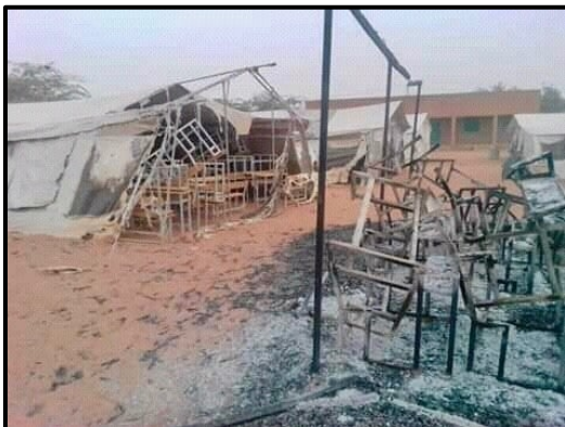
Photo 5 : Un espace d'apprentissage temporaire dans une école primaire publique de Djibo, au Burkina Faso, incendiée le 13 mars 2020, lors d'une attaque qui aurait été perpétrée par des islamistes armés

Fais le lien entre ces images et l'extrémisme violent.