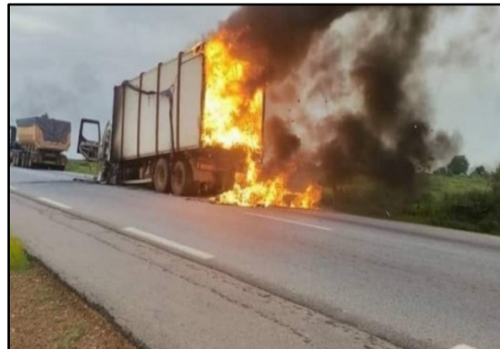
Photo 6 : Dégâts matériels suite à l'attaque terroriste d'un convoi de commerçants et leur camion à Bitou au Burkina Faso le 06 Août 2023

https://www.koaci.com/article/2023/08/07/burkina-