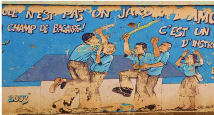
Photo 3 : image montrant une scène de violence en milieu scolaire